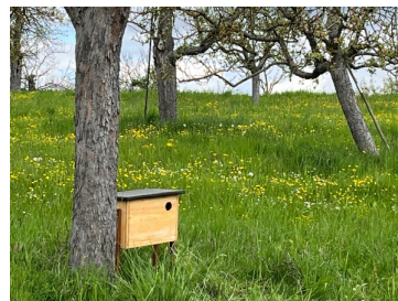
Nistkasten auf Streuobstwiese.