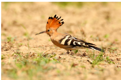
Wiedehopf auf Nahrungssuche.

Weiterführende Informationen zum Wiedehopf findet Ihr HIER .